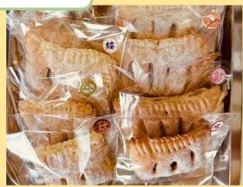
らくがきせんべい