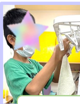
生活に必要な活動